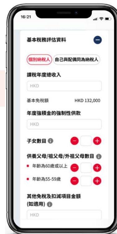
4. 輸入基本稅務資料