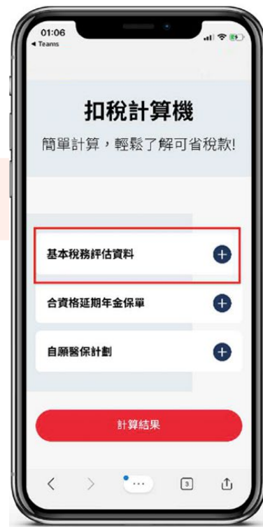
3. 點選「基本稅務評估資料」